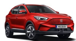
Červená - Diamond Red (metalická) 15 000 Kč